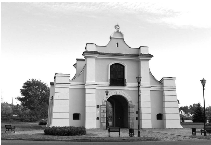
Ил. 1. Слуцкие ворота, современное состояние

окружающих город. Традиционным для архитектуры Беларуси данного периода элементом были въездные ворота, входившие в состав оборонительных городских укреплений и строящиеся на основных путях выезда из города [4].