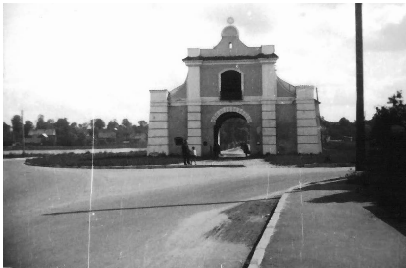
Ил. 2. Кольцевая автодорога вокруг Слуцких ворот, начало 1970-х гг. НВ 577.2

их хозяйственное и культовое предназначение. На первом этаже было создано помещение для стражи и чиновника, собирающего пошлину с въезжающих в город, а на втором размещалась часовня с резным дубовым алтарем и иконой Божьей Матери с младенцем Иисусом [4].