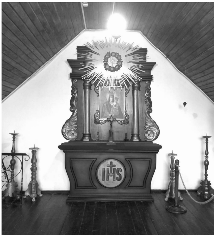
Ил. 4. Алтарь в часовне Слуцких ворот. Изготовлен и передан музею-заповеднику «Несвиж» общественной организацией “Stowarzyszenie Nieświeżan” («Общество несвижан»), Республика Польша

– «С молитвой на устах» (2017) История эмиграции из Западной Беларуси в 1920–1930-е гг. (фотографии, предметы из фондов, ростовые инсталляции).